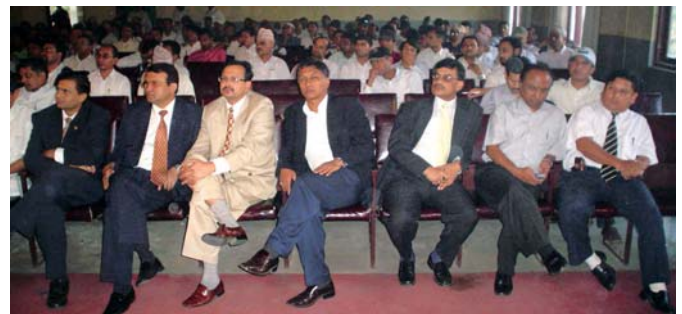
समारोहमा उपस्थित वरिष्ठ अधिकृत तथा कर्मचारीहरू