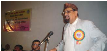
अर्थमन्त्री डा. महत

“प्राकृतिक सम्पत्ति धेरै हुँदाैमा मात्र देश धनी हुँदैन ।” उक्त कुरा माननीय अर्थमन्त्री डा. रामशरण महतले नेपाल वित्तीय संस्था कर्मचारी संघ नेपाल राष्ट्र बैंकद्वारा असोज १७ गते काठमाडौंमा आयोजित “अब पालो आर्थिक क्रान्तिको” विषयक विचार