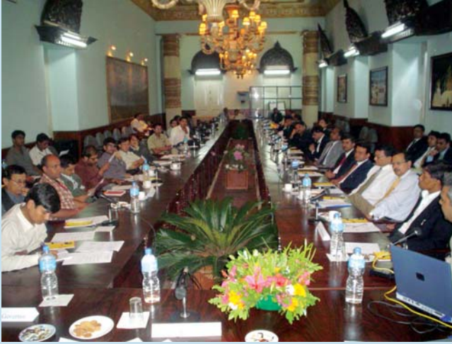
NRB-Media Relation : A Review विषयक अन्तरक्रियाको एक भ्रमलक