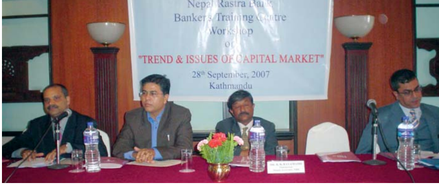
उद्घाटन समारोहको एक झलक