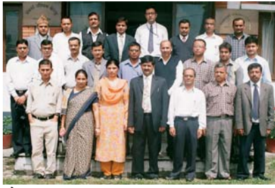
मौद्रिक तथा वित्तीय व्यवस्थापन तालिमका सहभागीहरू

बैंकर्स प्रशिक्षण केन्द्रले असोज १३ देखि १८ गतेसम्म काठमाडौंमा मौद्रिक तथा वित्तीय व्यवस्थापन (Monetary and Fiscal Management) विषयक तालिम संचालन गर्‍यो। मौद्रिक तथा वित्तीय क्षेत्रका विविध विषयको जानकारी दिने उद्देश्यले तालिम संचालन गरिएको थियो। तालिममा नेपाल राष्ट्र बैंकबाट १५, राष्ट्रिय योजना आयोगबाट २, अर्थ मन्त्रालय, महालेखा नियन्त्रकको कार्यालय र केन्द्रीय तथ्यांक विभागबाट १/१ गरी कुल २० जनाको सहभागिता रहेको थियो। तालिमको उद्घाटन केन्द्रका