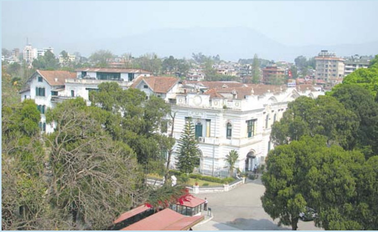
नयाँ वर्षलाई स्वागत : नेपाल राष्ट्र बैंक समाचार नववर्ष २०६५ को उपलक्ष्यमा बैंक परिवारका सदस्यहरूलाग्यत पाठकवृन्दहरूमा हार्दिक मंगलमय शुभकामना व्यक्त गर्दछ ।